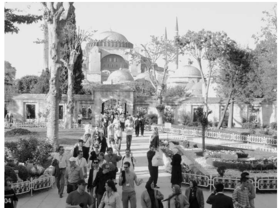
Alumni in Istanbul