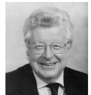
Lord Watson of Richmond