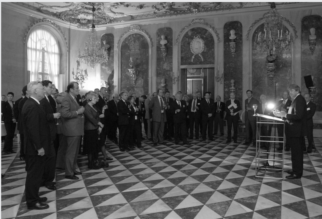
Empfang des StS Silberberg in den Neuen Kammern

Die FAZ hat am 14.05.2007 über die Konferenz berichtet. Der vollständige Konferenzbericht kann ab Juli auf der Internetseite der Deutsch-Britischen Gesellschaft abgerufen werden. ---